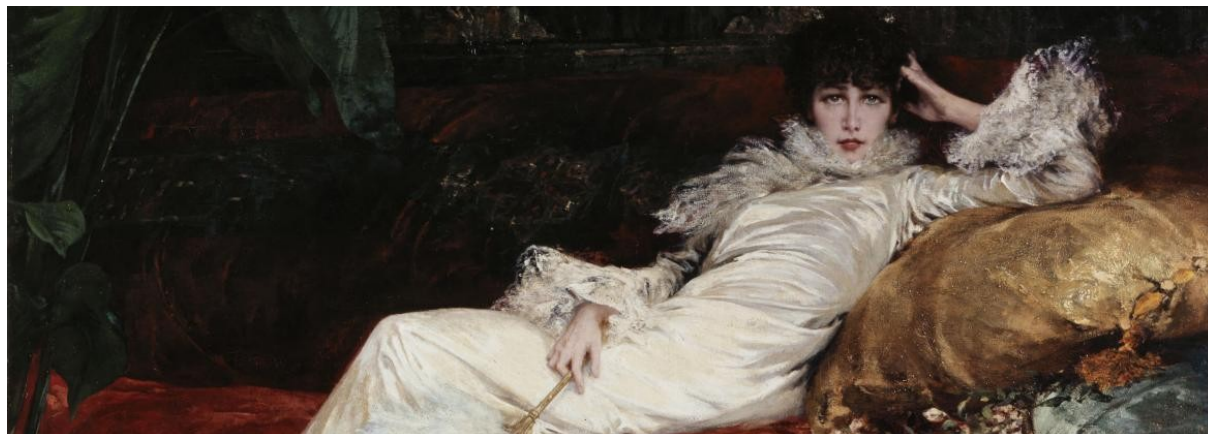
Figure emblématique du tournant des XIXe et XXe siècles, la « divine – Sarah Bernhardt, actrice tout autant qu’artiste, fait l’objet d’une exposition tout à fait exceptionnelle au Petit Palais, le musée détenant l’un de ses plus beaux portraits peint par son ami Georges Clairin, ainsi que plusieurs sculptures qu’elle a elle-même réalisées.

Interprète mythique des plus grands dramaturges comme Racine, Shakespeare, Victor Hugo, Edmond Rostand, elle ne cesse de triompher sur les scènes du monde entier. L’exposition évoquera ses plus grands rôles grâce à la présentation de ses costumes de scène, de photographies, de tableaux, d’affiches ... Sa « voix d’or » et sa silhouette longiligne, atypique à l’époque, fascinent autant le public que le monde artistique littéraire qui lui voue un véritable culte.